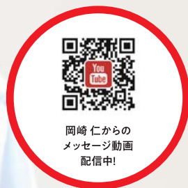
岡崎 仁からの メッセージ動画 配信中!