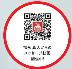
福永 真人からの メッセージ動画 配信中!