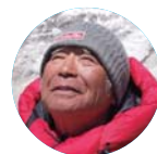
[特別ゲスト] プロスキーヤー・冒険家 三浦 雄一郎